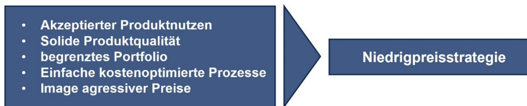
Abb. 3: Niedrigpreisstrategie (4)

Nach Achim Lummer (4) lassen sich folgende spezifischen Erfolgsfaktoren einer Niedrigpreisstrategie definieren: